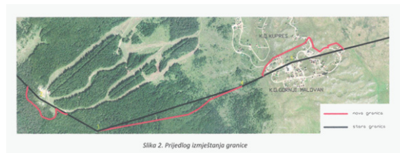
Slika 2. Prijedlog izmještanja granice